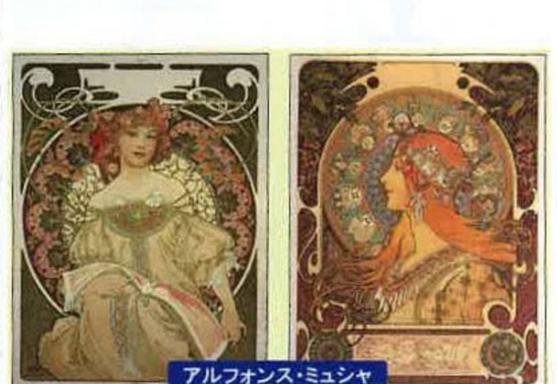
ミュシャの女性像

スタイルは、まさに「アー・ヌーヴォー」新しい美術」だったわけだ。作品の特徴である「植物