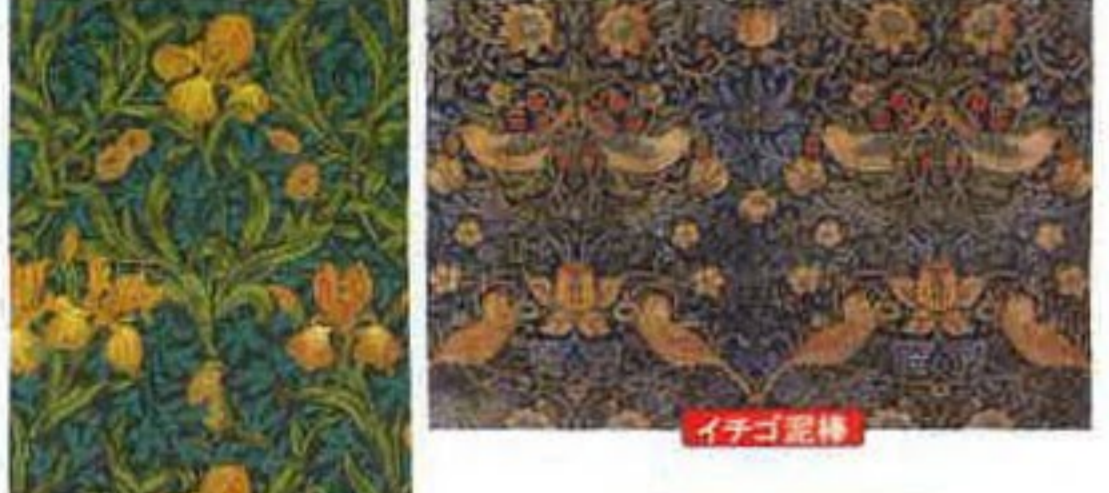
ウィリアム・モリス

機動戦記ガンダムWのパッケージといったように、アニメ漫画の世界でもリスベクトされている。昨年、ミュシャ展が六本木の国立新美術館で開催され、彼の大作『スラブ叙事詩』20点すべてが展示され話題を呼んだ。人気は断トツで、昨年に開催された美術展の入場者ランキングを3位まで紹介すると、1位は新国立美術館の『ミュシ